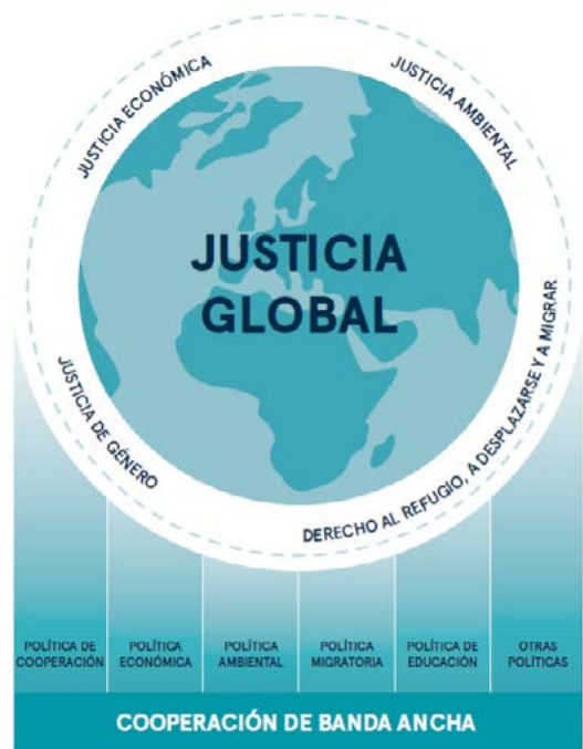
Imagen tomada del Pla Director de Cooperació per a la Justicia Global de Barcelona 2018-2021

El hecho de entender las desigualdades como consecuencia de una vulneración de #DDHH interpela directamente a la Administración y conduce a buscar la raíz de los problemas para encontrar políticas transformadoras que amplíen el disfrute de los derechos. Una cooperación de banda ancha asume las crecientes interdependencias, así como la transversalidad y la complejidad de los problemas que afectan al mundo.